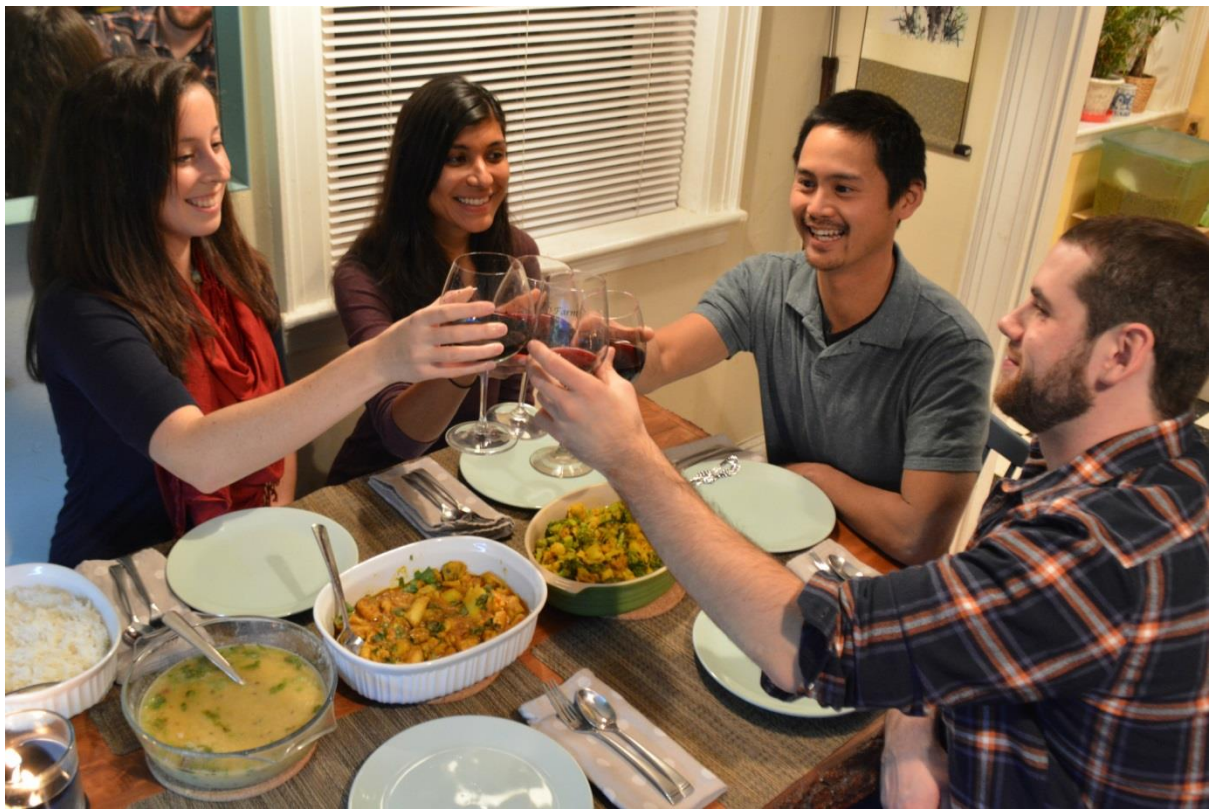
ง่าย เป็นมิตร และฟรี

TalkTalkBnb แตกต่างจากการพักอาศัยฟรีในรูปแบบอื่นๆ เพราะไม่ได้ทำให้คุณรู้สึกเหมือนกำลังรบกวนเจ้าบ้าน เนื่องจากคุณให้มากเท่ากับที่คุณได้รับ ถ้าคุณรู้ว่าคุณจะเรียนภาษาแพงแคไหนแล้วล่ะก็ คุณจะรู้ว่าไม่มีใครได้เปรียบเสียเปรียบในจุดนี้