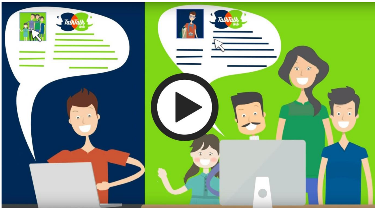
เปรียบเทียบกับ Couchsurfing และ Airbnb

“ยิ่งไปกว่านั้น” ผู้ก่อตั้งเว็บไซต์เสริม “แขกมักจะบอกวิธีทำอาหารประจำชาติหรือเล่าเรื่องศิลปะให้เจ้าบ้านฟัง ขณะที่เจ้าบ้านก็มักให้คำแนะนำที่เป็นประโยชน์เกี่ยวกับสถานที่ท่องเที่ยวต่างๆ ด้วยวัฒนธรรมที่แตกต่างกันทำให้มีเรื่องมากมายให้แบ่งปัน”